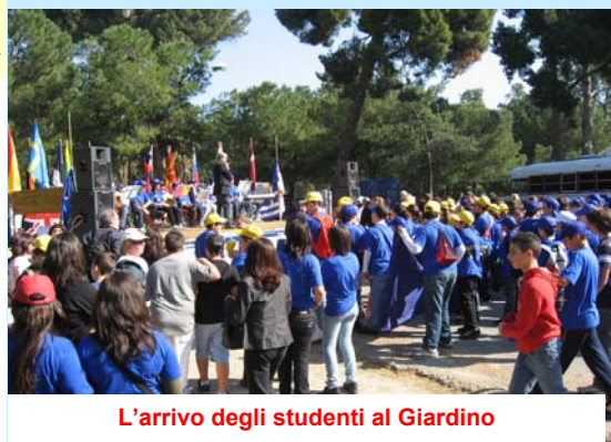
L'arrivo degli studenti al Giardino

Alla Festa dell'Europa quest'anno hanno partecipato più di mille ragazzi di tutte le scuole di Palermo che hanno presentato presso i laboratori allestiti al Giardino Inglese, i lavori realizzati durante tutto l'anno scolastico.