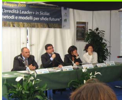
Un momento del Seminario Leader+

Giorno 18 maggio alle ore 8,30 è prevista presso la sede dell'Assemblea Regionale Siciliana, la simulazione di una seduta